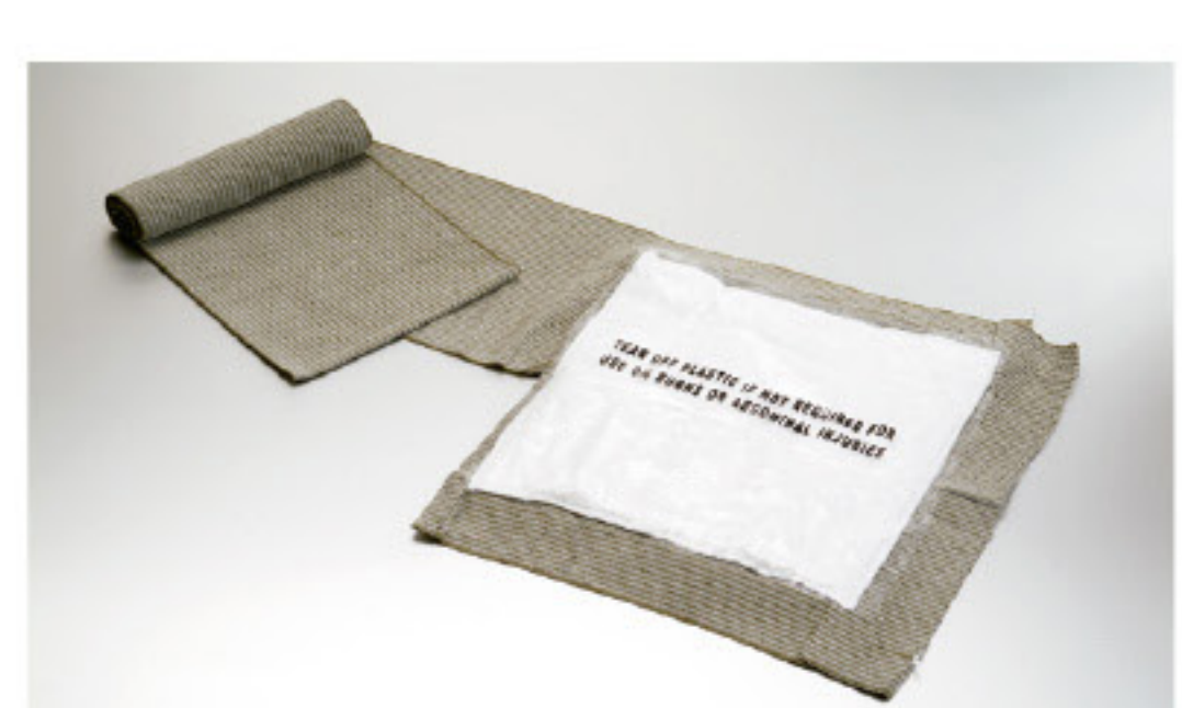
Modelo: FCP14 Bandagem multifuncional militar Dimensão: 12 polegadas/30 cm Paterno: 101401500