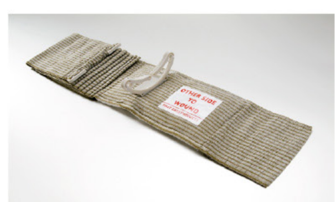
Modelo: FCP01 Bandagem pessoal militar de campo Dimensão: 4 polegadas/ 10 cm Paterno: 100101500