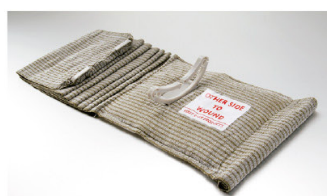
Modelo: FCP02 Bandagem pessoal militar de campo Dimensão: 6 polegadas/15 cm Paterno: 100201500