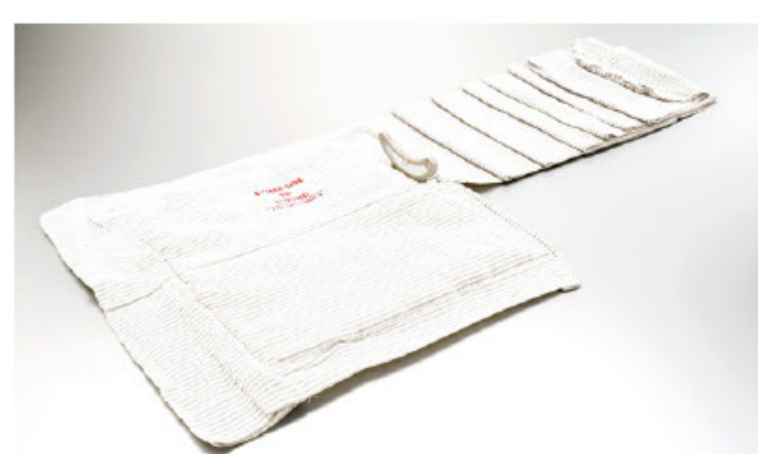
Modelo: FCP10 Bandagem pessoal civil de emergência com curativo para ferida de grande extensão Dimensão: 12 polegadas/ 30 cm Paterno: 101001500