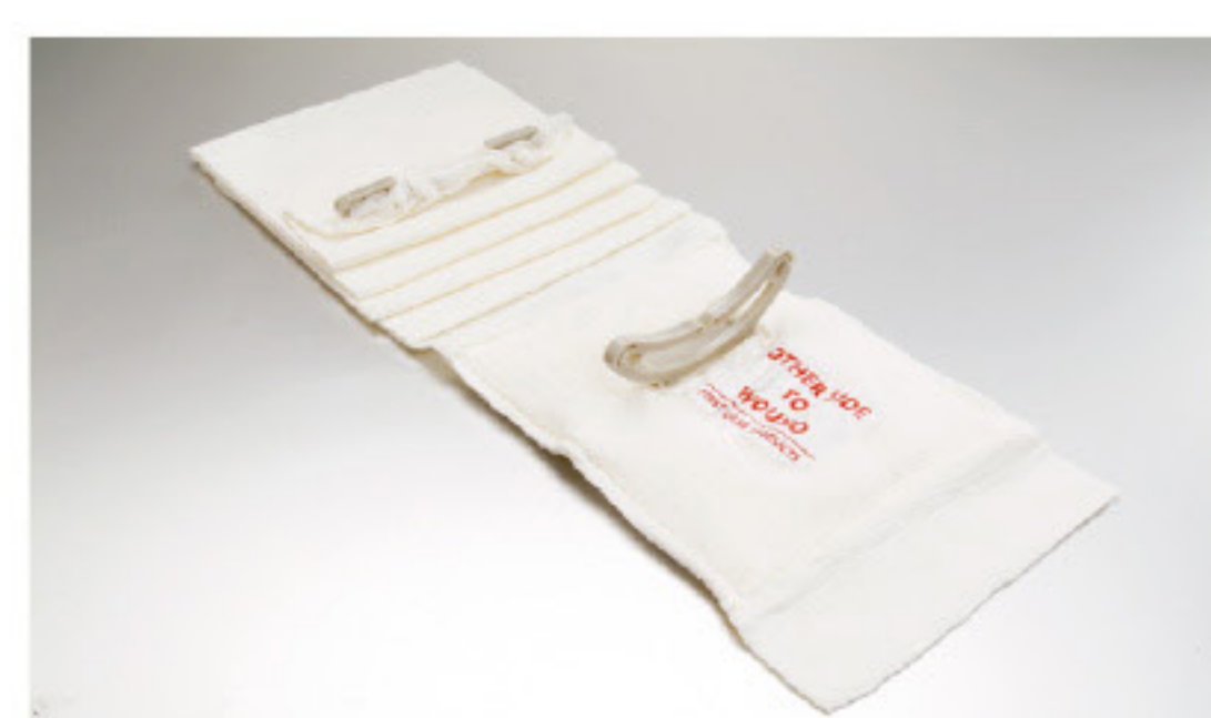
Modelo: FCP06 Bandagem pessoal civil de emergência Dimensão: 6 polegadas/ 15 cm Paterno: 100601500