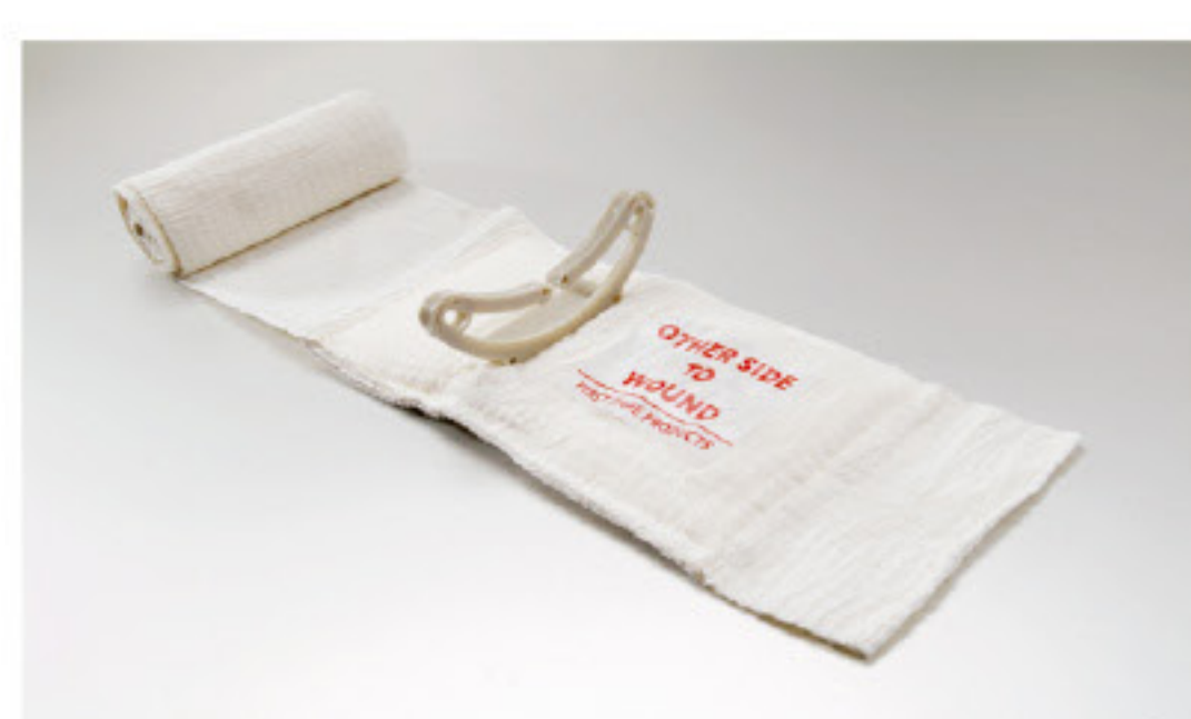
Modelo: FCP03 Bandagem pessoal civil de emergência Dimensão: 4 polegadas/ 10 cm Paterno: 100301500