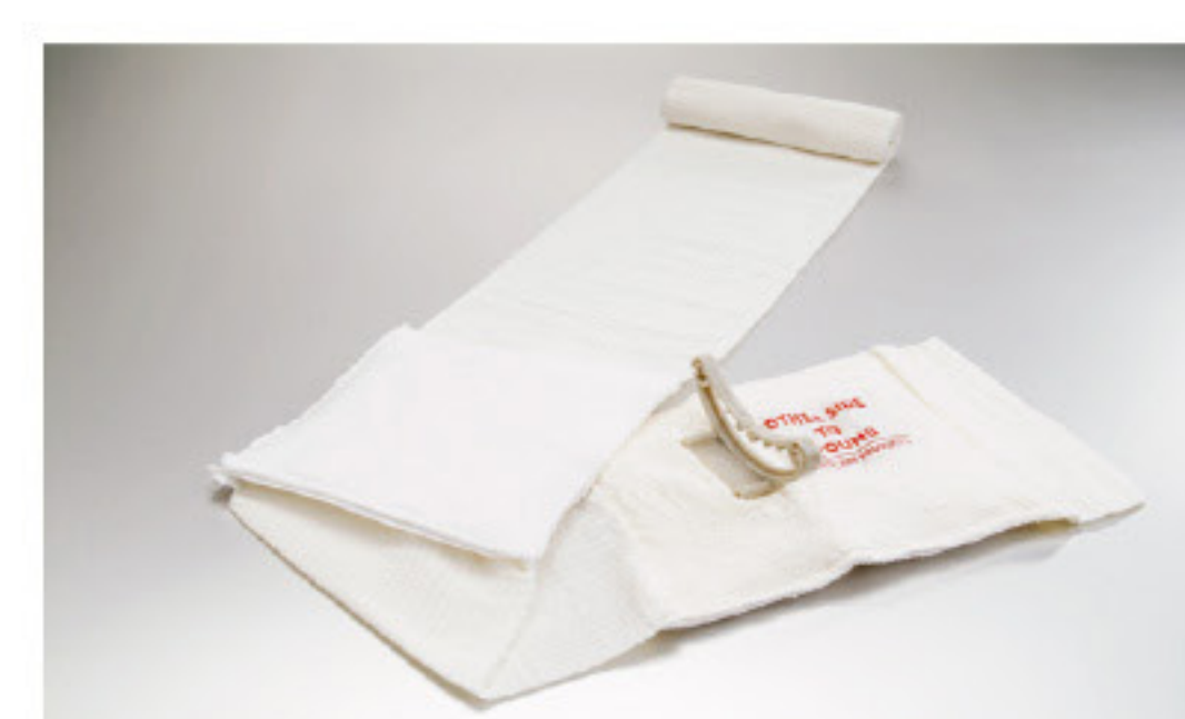
Modelo: FCP11 Bandagem pessoal civil de emergência com segundo curativo móvel para feridas entrada-saída Dimensão: 4 polegadas/ 10 cm Paterno: 10101500