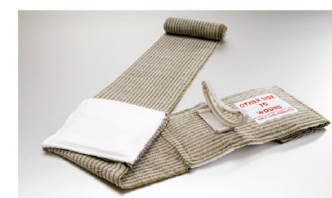
Modelo: FCP07 Bandagem pessoal militar de campo com segundo curativo móvel para feridas entrada-saída Dimensão: 4 polegadas/10 cm Paterno: 100701500