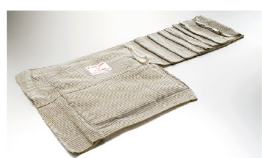
Modelo: FCP09 Bandagem militar abdominal / curativo para ferida de grande extensão Dimensão: 12 polegadas/30 cm Paterno: 100901500