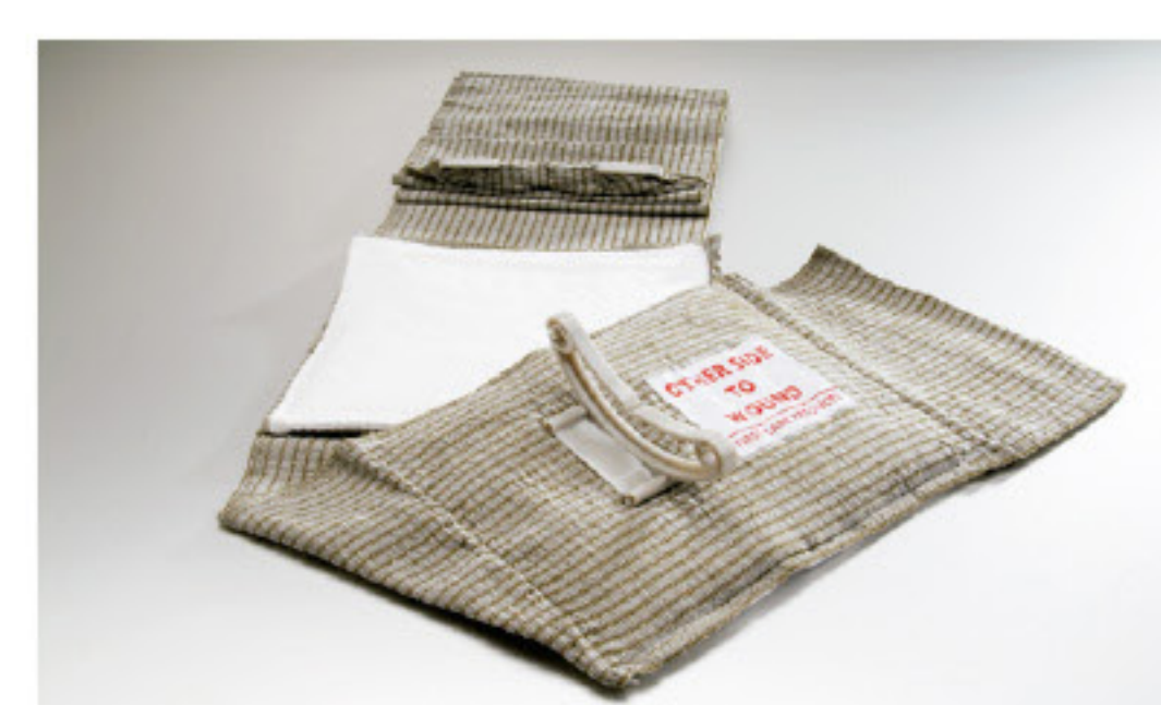
Modelo: FCP05 Bandagem pessoal militar de campo com segundo curativo móvel para feridas entrada-saída Dimensão: 6 polegadas/15 cm Paterno: 100501500