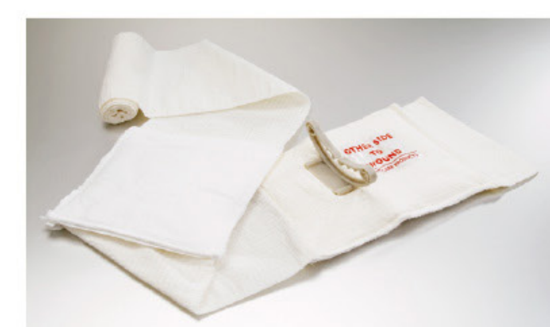
Modelo: FCP12 Bandagem pessoal civil de emergência com segundo curativo móvel para feridas entrada-saída Dimensão: 6 polegadas/ 15 cm Paterno: 101201500