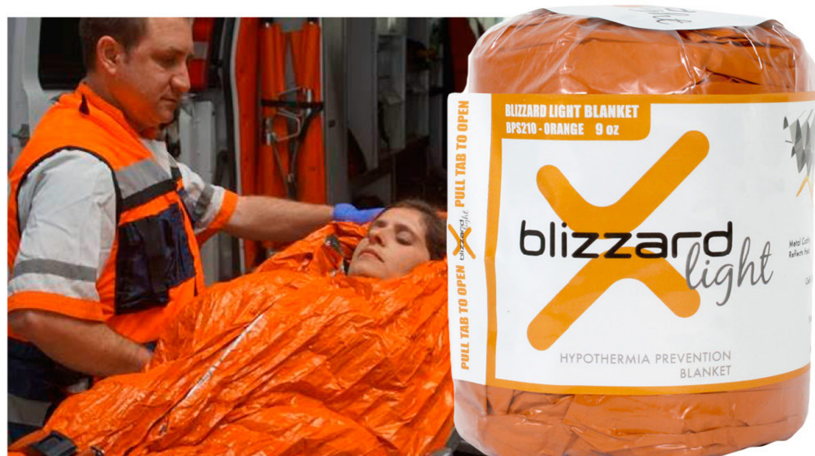
Blizzard Light Blanket