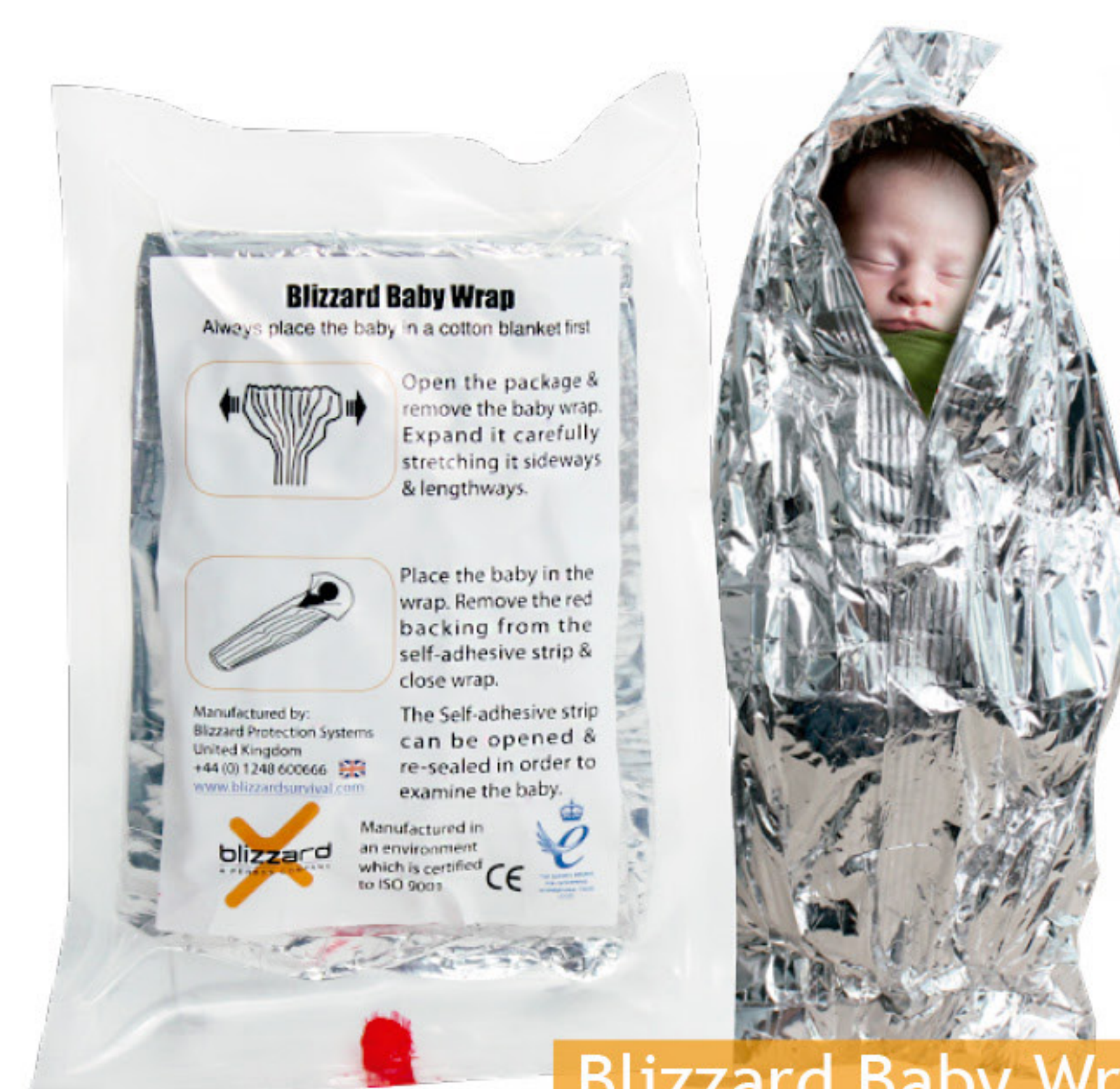
Blizzard Baby Wrap