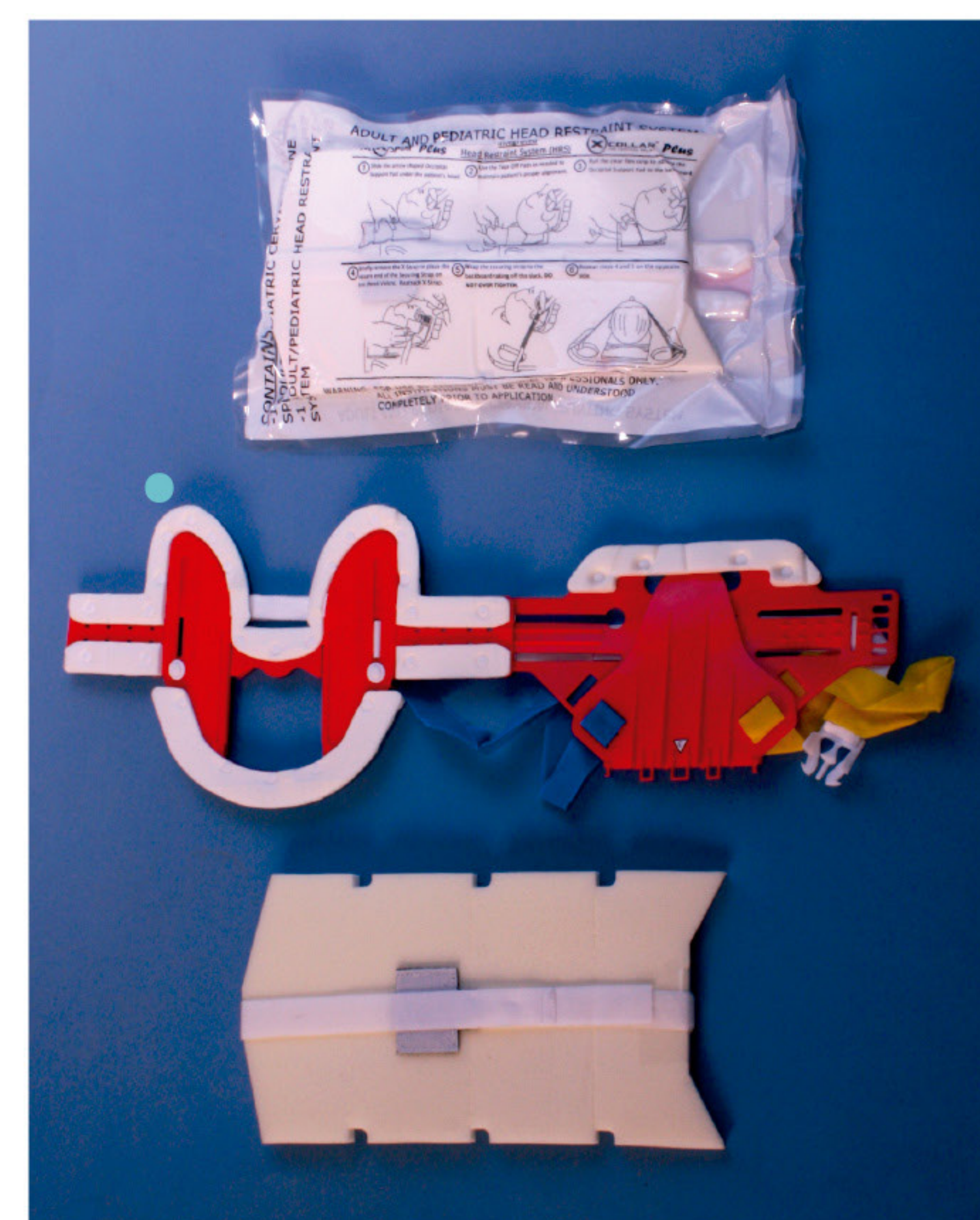
NextSplint Plus - Sistema dobrável

Além disso, a grande abertura na região da traqueia permite verificações do pulso carotídeo, procedimentos de vias aéreas avançadas e avaliação visual fácil.