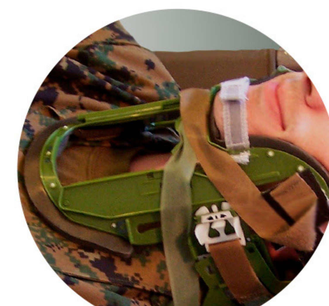
Versão Verde Militar

Disponível nas cores: clara de alta visibilidade, laranja e verde militar.